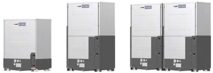
PQHY-P200YLM-A1 PQHY-P250YLM-A1 PQHY-P300YLM-A1