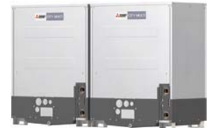
PQHY-P400YSLM-A1 PQHY-P450YSLM-A1 PQHY-P500YSLM-A1 PQHY-P550YSLM-A1 PQHY-P600YSLM-A1