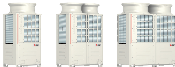
PURY-P200YNW-A PURY-P250YNW-A PURY-P300YNW-A