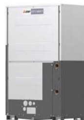
PQRY-P350YLM-A1 PQRY-P400YLM-A1 PQRY-P450YLM-A1 PQRY-P500YLM-A1 PQRY-P550YLM-A1 PQRY-P600YLM-A1