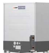
PQRY-P200YLM-A1 PQRY-P250YLM-A1 PQRY-P300YLM-A1