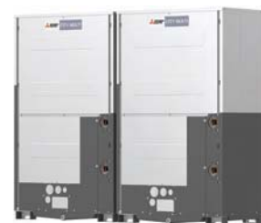
PQRY-P700YSLM-A1 PQRY-P750YSLM-A1 PQRY-P800YSLM-A1 PQRY-P850YSLM-A1 PQRY-P900YSLM-A1