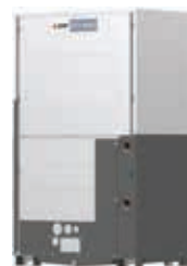
PQRY-P350YLM-A1 PQRY-P400YLM-A1 PQRY-P450YLM-A1 PQRY-P500YLM-A1 PQRY-P550YLM-A1 PQRY-P600YLM-A1