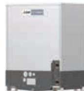
PQRY-P200YLM-A1 PQRY-P250YLM-A1 PQRY-P300YLM-A1