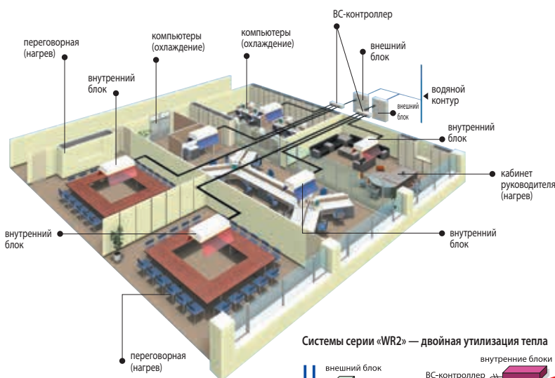
Системы серии «WR2» — двойная утилизация тепла