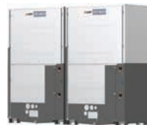
PQRY-P700YSLM-A1 PQRY-P750YSLM-A1 PQRY-P800YSLM-A1 PQRY-P850YSLM-A1 PQRY-P900YSLM-A1